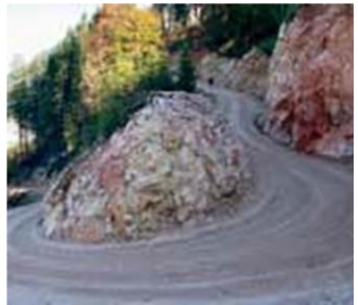
Fotos: Gewerbegebiet Koppl, Schigebiet Königsleiten, Forststraße am Untersberg