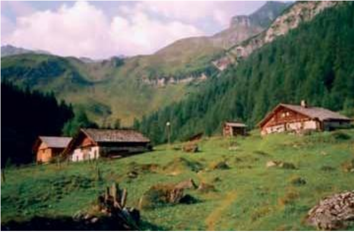
Bild: Litzlhofalm im Rauriser Seidlwinkeltal