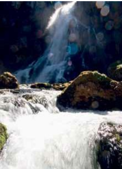
Bild: Gollinger Wasserfall

(vollständige Auflistung unter: https://www.salzburg.gv.at/themen/natur/naturschutzrecht-2/naturschutzrecht-salzburg/gebietsschutz/naturdenkmaeler )