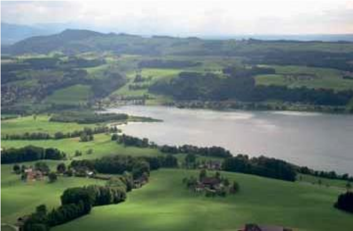
Bild: Trumer Seen

(vollständige Auflistung unter: https://www.salzburg.gv.at/themen/natur/naturschutzrecht-2/naturschutzrecht-salzburg/gebietsschutz/naturschutzgebiet )